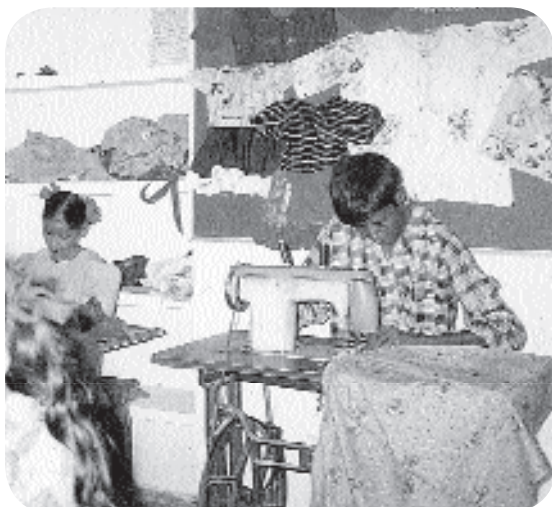
Apprentissage dans la couture

Sanchar a débuté grâce au soutien de MIBLOU, il y a de nombreuses années. C’est donc avec plaisir que MIBLOU l’a inclus dans son “Action 2000”. Son programme de développement et de soutien aux familles d’enfants handicapés se déroule dans une centaine de villages aux environs de Calcutta.