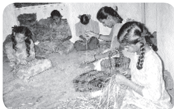
Leçon de vannerie

Il est temps de penser à leur avenir et de donner la chance à vingt d’entre eux de suivre une formation dans l’horticulture, la couture et la vannerie. Pour l’organisation BCT ceci est un nouveau défi qu’ils espèrent renouveler rapidement.