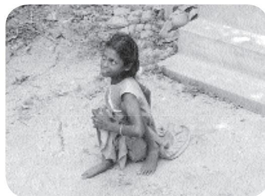
Le sort de milliers d'enfants : vivre au ras du sol et ramper