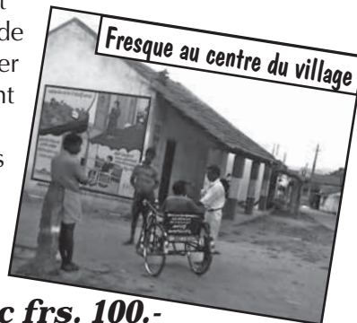
Fresque au centre du village

Ils comprennent enfin la nécessité d'avoir des W.C. MIBLOU a aussi mandaté Mobility India, l'ONG qui gère ce programme, pour peindre des fresques géantes dans chaque village où se trouve des constructions de latrines MIBLOU. C'est principalement sur les façades des écoles qu'elles sont peintes, ce qui permet de sensibiliser en premier lieu les enfants qui seront les adultes de demain ! A ce jour, 25 fresques sont terminées et il est prévu de quadrupler leur nombre d'ici l'an prochain.