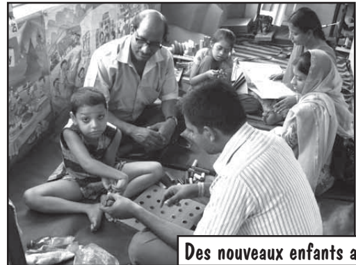
Des nouveaux enfants arrivent.

Le programme de la Spastic Society, qui prend en charge des enfants et adultes handicapés, s'est étendu à 59 circonscriptions sur les 144 que compte la ville de Kolkata.