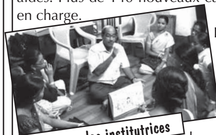
Cours pour les institutrices

Plus de 500 visites à domicile ont été effectuées dans les bidonvilles par des membres de la Spastic Society afin d'évaluer les progrès des enfants. Petit à petit la confiance s'installe et lors de ces rencontres les parents osent s'approcher pour recevoir des conseils et des aides. Plus de 140 nouveaux cas ont ainsi pu être pris en charge.