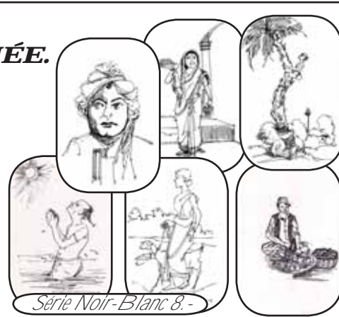
Série Noir-Blanc 8.-