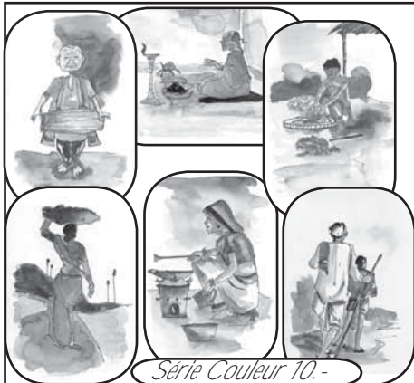
Série Couleur 10.-