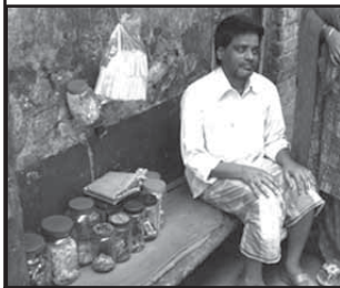
Non-voyant, il a ouvert sa petite échoppe grâce au CBR

MIBLOU a été une des toutes premières organisations à reconnaître les immenses possibilités qu'offre le CBR pour les enfants handicapés.