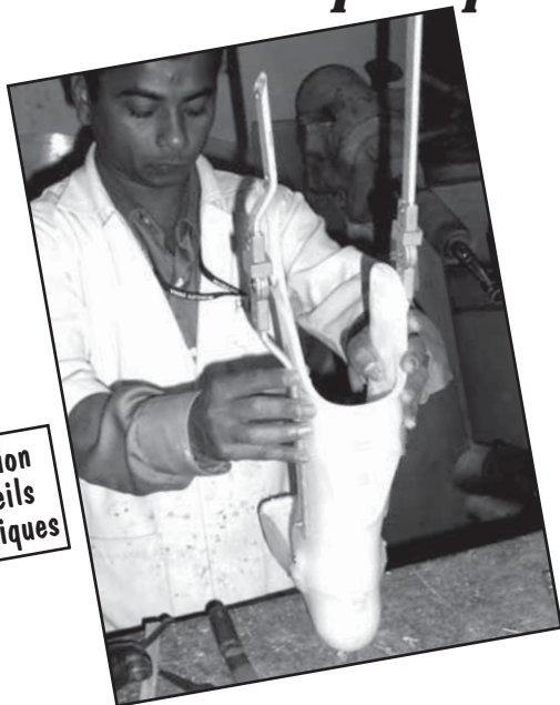
Fabrication d'appareils orthopédiques

MIBLOU a offert des appareils orthopédiques et d'autres aides à la mobilité à 300 enfants venant de familles défavorisées. Grace à cela, les portes des écoles s'ouvrent pour eux. Un avenir plus souriant se dessine pour ces enfants qui sont désormais debout comme les autres.