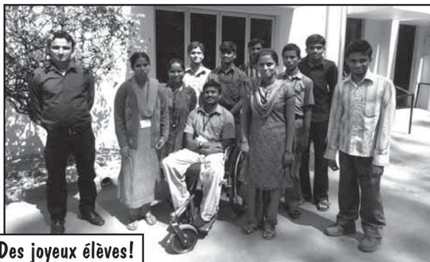
Des joyeux élèves!

Avec frs.40.- par mois soutenez ces formations afin que ces jeunes trouvent leur place dans une société en plein essor économique.