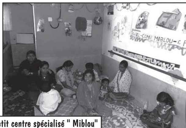
Petit centre spécialisé " Miblou"

Pour ceux qui ne peuvent pas être intégrés dans une classe ordinaire à cause d'un handicap trop sévère, il y a des petits centres où ils peuvent suivre des cours adaptés à leurs capacités.