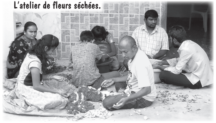
L'atelier de fleurs séchées.

GASS va agrandir et modifier son petit bâtiment administratif avec l'ajout d'un étage supplémentaire. Ceci permettra de loger ces jeunes gens en toute sécurité et d'économiser des frais de loyer.