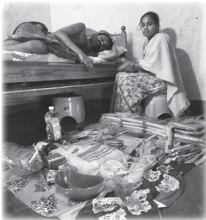
Distribution de matériel paramédical.

En avril, l'ONG T.A.P. s'est mise à confectionner des centaines de « kits de santé » avec du matériel paramédical varié pour venir en aide aux personnes paraplégiques alitées, confinées et en manque de moyens financiers. MIBLOU a soutenu cette action en offrant 80 kits.