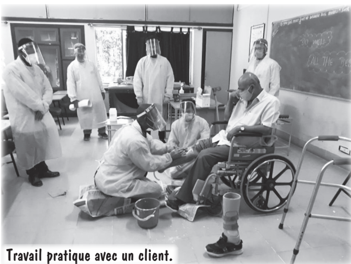
Travail pratique avec un client.

La Covid19 a entraîné divers changements dans le système d'éducation à l'échelle mondiale. Mobility India s'est rapidement adapté et en quelques mois les professeurs ont pu proposer des séances théoriques et pratiques en ligne. Les étudiants ont pu terminer leurs programmes de fin de formation avec succès.