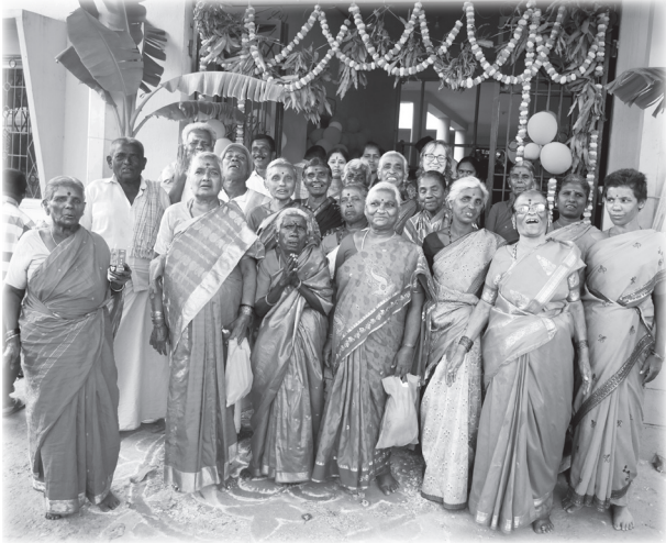
Les grand-mamans si précieuses.

Un exemple parmi eux, la réhabilitation à base communautaire dans les villages (CBR – RBC). Ce programme est autonome depuis quelques années. La Maison de Partho, créée et ouverte en 2005, héberge une trentaine de jeunes adultes souffrant de déficience mentale. Avec eux logent 15 femmes âgées, souvent veuves et rejetées par leur famille, qui font office de grand-mamans et prennent part au bien-être de tous.