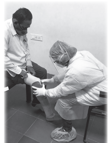
Essayage de prothèse.

En cette année particulière, il a été difficile d'élire un ou une élève pour le Grand Prix du Mérite Jo Millar. C'est remis à 2021.