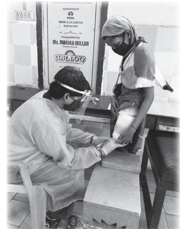
Essayage de prothèse.

prothèses et d'autres aides à la marche, sans oublier des chaises spéciales et des fauteuils roulants personnalisés. Le centre T.A.P. s'est fait un nom dans la ville de Visakhapatnam et reçoit des commandes de homes pour enfants en situation de handicap.