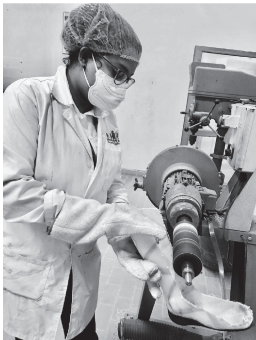
Les étudiantes en cours pratiques.

MIBLOU est venu à leur secours le temps qu'elles trouvent une solution de financement, grâce à un frère ou un oncle, afin qu'elles puissent terminer leurs formations.